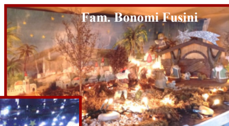
Fam. Bonomi Fusini